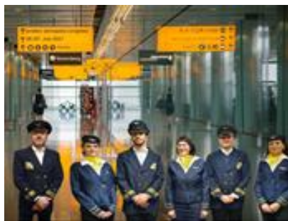
Piloten begleiten den AACII Congress am Dienstag 5. und Mittwoch 6. Juli.2022