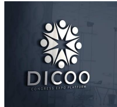
Discover the new Expo Plattform - DICOO