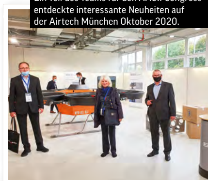
Ein Teil des Teams für den AACII Congress entdeckte interessante Neuheiten auf der Airtech München Oktober 2020.

und internationale Studenten der Luft- und Raumfahrt begleiten durch den Kongress als Plattform für die Exzellenz der Wissenschaft und Industrie in B2B-Meetings, Workshops und Vorträgen und eine Hightec Rundfahrt durch Franken lassen das Interesse für den AACII Congress rasant wachsen.